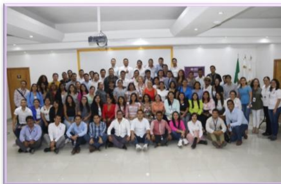
MESA DE TRABAJO CON PERSONAS DE LA COMUNIDAD LGBTQ+, ACCIONES AFIRMATIVAS PARA SU PARTICIPACIÓN POLÍTICA.