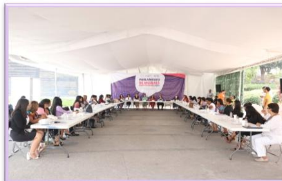
MESA DE TRABAJO CON JUVENTUDES, ACCIONES AFIRMATIVAS PARA SU PARTICIPACIÓN POLÍTICA.