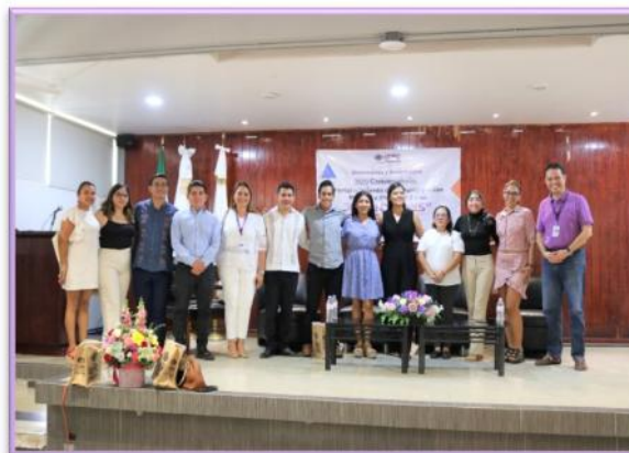
CONVERSATORIO “FORTALECIMIENTO DE LA PARTICIPACIÓN POLÍTICA Y ELECTORAL DE LA POBLACIÓN LGTBTTIQ+”.