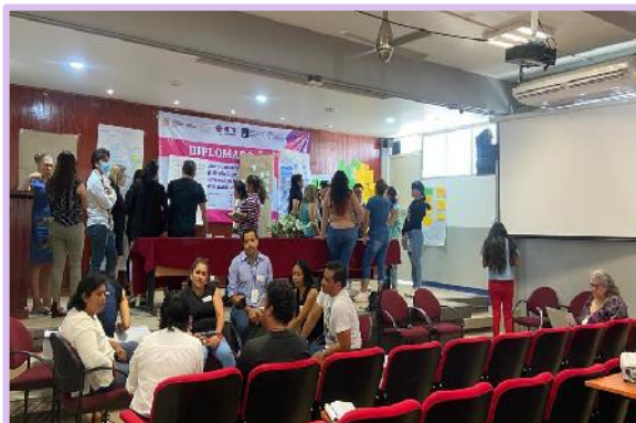
PARLAMENTO DE MUJERES GUERRERENSES 2023.